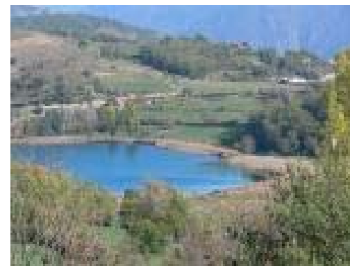
L'estany de Montcortés

4.3. (22 min.) ESTANY DE MONTCORTÈS (1025 m). S'arriba a un dels embarcadors de l'estany. Es continua per un camí a la dreta, sempre vorejant l'estany fins a trobar una àmplia pista forestal, just a una cruïlla a la vora sud de l'estany. Aquí hi ha un berenador amb font i un lloc on es pot fer acampada. El voltant d'aquest estany està cobert de canyissars on crien algunes aus aquàtiques. Es retorna al poble tot deixant la pista a la dreta. S'arriba a la carretera de Montcortés i es continua a la dreta cap al poble. S'entra al poble pel mateix vial encimentat pel que s'ha anat a l'estany.