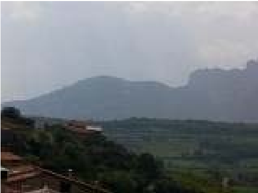
La silueta de la Geganta adormida

7. (30 min.) LES ESPLANES (920 m). Al mig d'un alzinar amb alguns roures, es deixa el camí carreter i es continua per un altre a la dreta; en el desviament destaquen uns grans blocs de pedra. Més avall es passa per sota d'una petita línia elèctrica. Aquest és l'antic camí de ferradura cap a Pujol. A la dreta, situada sobre la paret de pedra, pot observar-se una creu de terme, d'aspecte rústic, de l'any 1622 on al davant hi ha la cara de crist i per darrera la de la Mare de Déu. Es baixa per l'antic camí entre roures i alzines. Més avall, es deixa un camí que baixa a l'esquerra i després un altre caminet a l'esquerra. Metres més endavant, el camí s'eixampla en suau baixada. Al cap de poc apareix un caminet per l'esquerra i més enllà n'apareix un altre per la dreta que ve d'un camp de conreu. Es continua per l'esquerra; al sud-oest s'observa la silueta que formen els cims de la serra de Peracalç, la Geganta Adormida. Poc després, s'enllaça amb una altra pista forestal que ve per l'esquerra d'un camp de conreu d'on sobresurt una torre de línia elèctrica. En aquesta cruïlla, es pren de nou el camí de ferradura que continua per la dreta entre marges de pedra. Es passa per sota d'una línia elèctrica i torna a aparèixer la pista forestal que cal seguir a la dreta. S'arriba a la carretera que va al poble de Pujol.