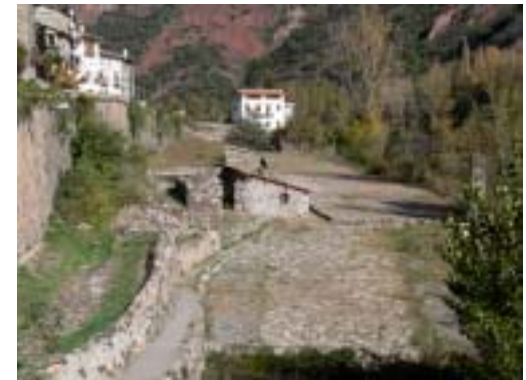
Els salins del Roser i la Mola al fons

4.3. Es retorna a l'entrada del pàrquing pel mateix camí.