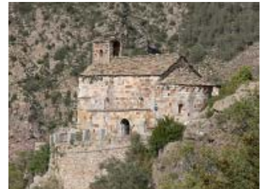
El Santuari de la Mare de Déu D'Arboló