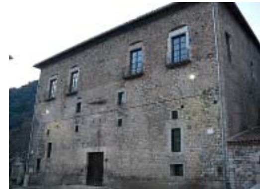
L'Alfolí de Gerri de la Sal

Recomanacions: Excursió apte per a tothom. El desnivell és mínim i la distància curta. Es pot dur a terme tot l'any.