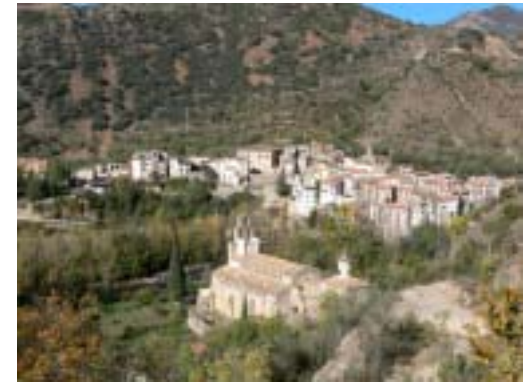
L'església i la vall de Gerri de la Sal

13. (21 min) CARRETERA DE REIG - PLANTER DE GERRI (600 m). Es retorna a Gerri pel mateix camí del principi.