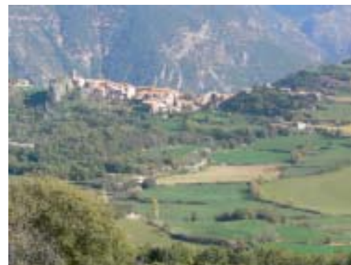
Peramea i el Pla de Corts

2. PERAMEA (900 m). Població declarada "Bé cultural d'interès nacional" a causa de l'important i variat patrimoni que s'hi conserva. A la mateixa plaça on es deixa el cotxe, hi destaquen l'om centenari i el safareig públic que encara avui es fa servir. De la vila en si també destaquen: l'estructura medieval del poble en forma de vila closa (la façanes exteriors de les cases fan de muralla del recinte), el carrer porxat de Sant Cristòfol, l'església de Sant Cristòfol (s. XIV), la Roca del Castell de sobre l'església (lloc on s'assentava l'antic castell i